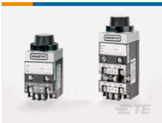
TE 产品编号 2-1423159-6 7012PD=RLY,STD,ON,2P,125VDC,50