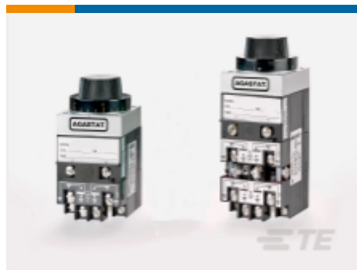
TE 产品编号 1755170-1 7022OCIM=RLY,STD,OFF,2P,24V,15S,I,M