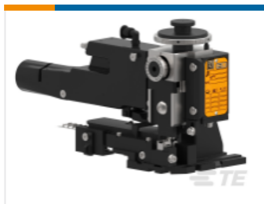
TE 产品编号2837098-2 OCEAN_2.0-APPLICATOR-S-115F150O