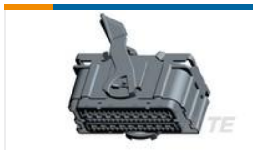
TE 产品编号5-2098922-8 SDM,54P PLUG ASY,RHL,KEY D