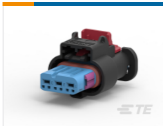
TE 产品编号5-2297811-3 3POS,HPF 1.2,REC HSG,ASSY,SLD