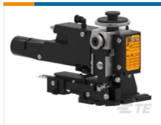
TE 产品编号2836951-2 OCEAN_2.0_Applicator-S-236F335O