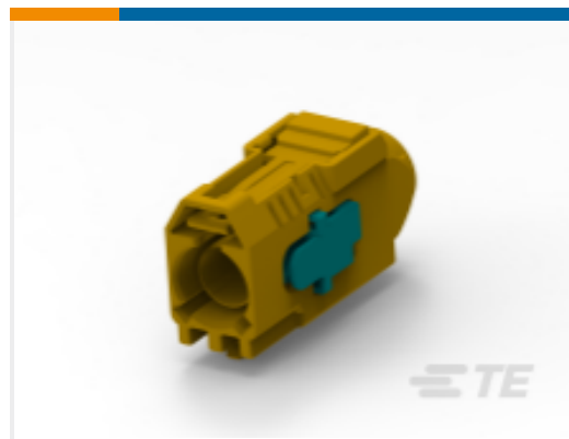
TE 产品编号1-2359321-0 FEMALE KIT, EWCAP, 1P, FAKRA