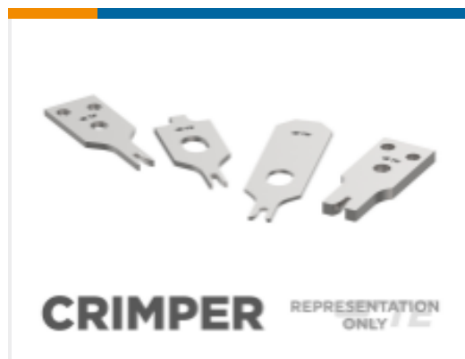
TE 产品编号3-1803453-5 CRIMPER,INSULATION O