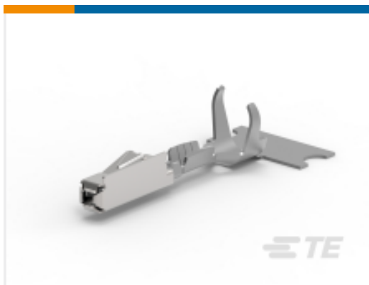
TE 产品编号2141826-5 MQS0,63 Au rec LL EDS 0,08-0,22