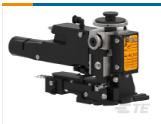
TE 产品编号2836954-2 OCEAN-2.0-APPLICATOR-S-190F244F