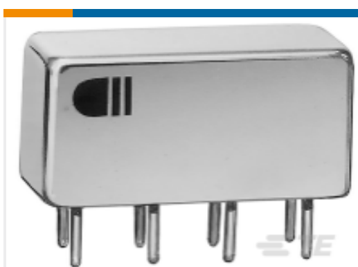
TE 产品编号1617073-2 3SBC1762A2 = M39016/13-096L