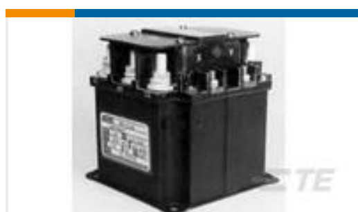
TE 产品编号1616004-5 B312CV=RELAY