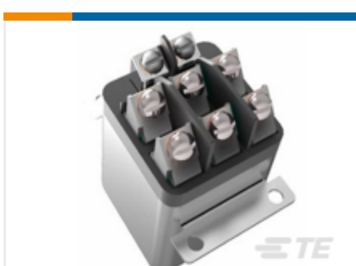
TE 产品编号1617807-4 FC-335-SY4=RELAY, 3PST