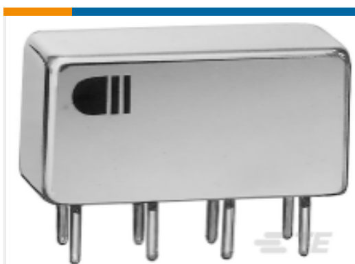
TE 产品编号 3-1617073-4 3SBC2091A2 = M39016/37-021P