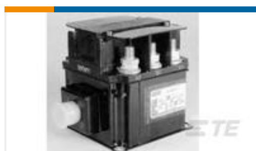
TE 产品编号1616005-4 B429CA (FAA/PMA)=RELAY