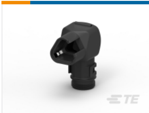
TE 产品编号1011-232-0305 BKSHL, 3P, BLK, PLG, RA, NW6/7.5/8.5/10