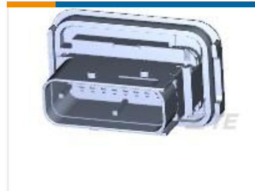
TE 产品编号2-1564532-1 15POS, MIXED, TAB HSG, ASSY