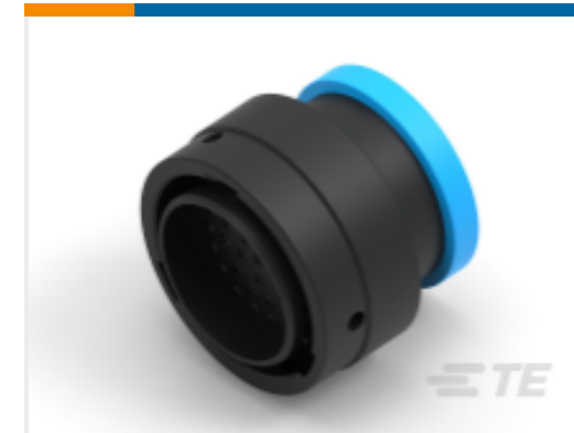
TE 产品编号YHDP26-24-35PEL017 PLG, 35P, BLK, E, RNG, 16/20, P