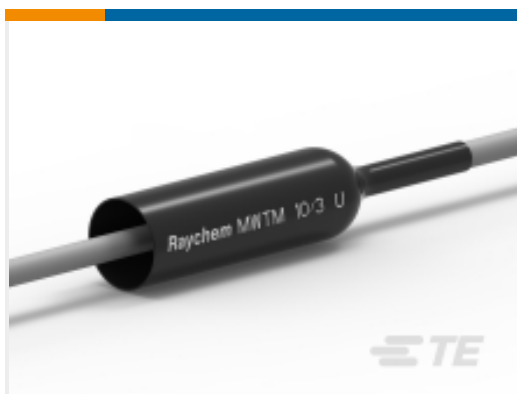
TE 产品编号834936-000 MWTM-10/3-100/S(S100)