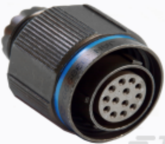
TE 产品编号YACT26MJ19BAV00100 STRAIGHT PLUG