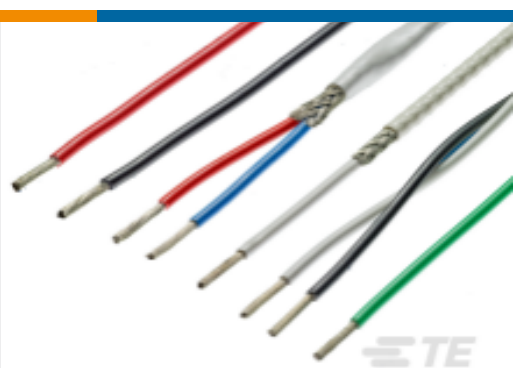
TE 产品编号112799-000 81044/9-14-2