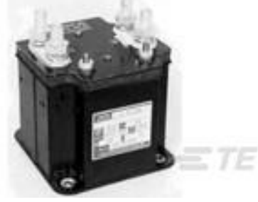
TE 产品编号 2-1616058-5 A712H=RELAY