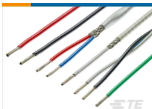
TE 产品编号511269-002 81044/9-16-6