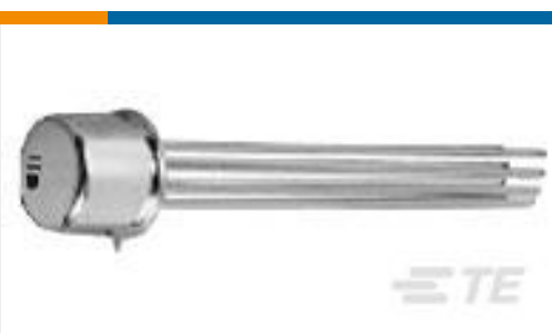
TE 产品编号2-1617564-4 J1MACD-26XLS=M39016/23-036L