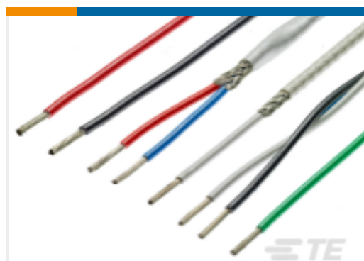
TE 产品编号265717-000 81044/9-20-5