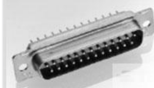
TE 产品编号204537-2 AMPLIMITE,ASY,PLUG,FB,90,1,CONT