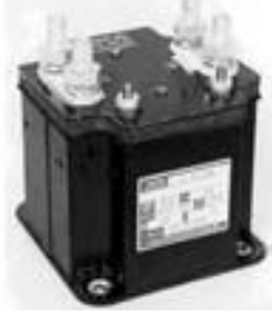
TE 产品编号 2-1616058-4 A712AF=RELAY