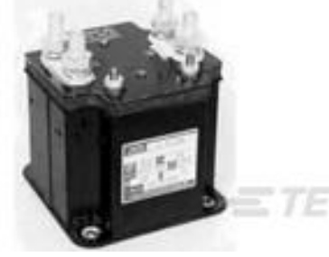
TE 产品编号 6-1616032-3 A712W (FAA/PMA)=RELAY