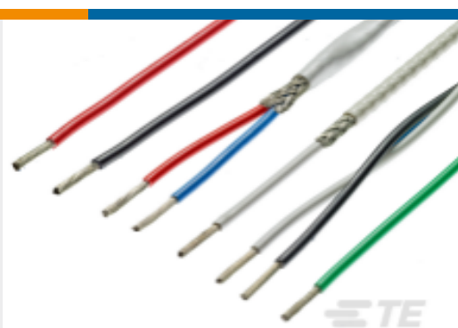
TE 产品编号706169-000 44B4121-20-9/96-9CS2275