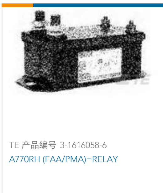
TE 产品编号 3-1616058-6 A770RH (FAA/PMA)=RELAY