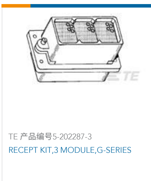
TE 产品编号5-202287-3 RECEPT KIT,3 MODULE,G-SERIES