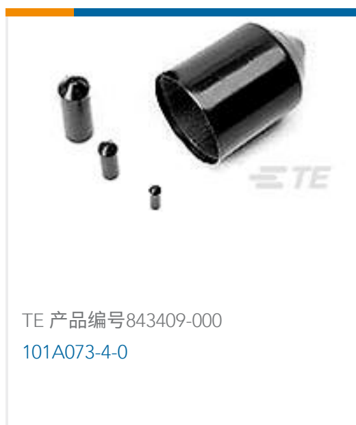
TE 产品编号843409-000 101A073-4-0