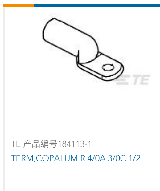
TE 产品编号184113-1 TERM,COPALUM R 4/0A 3/0C 1/2