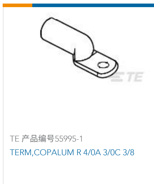
TE 产品编号55995-1 TERM,COPALUM R 4/0A 3/0C 3/8