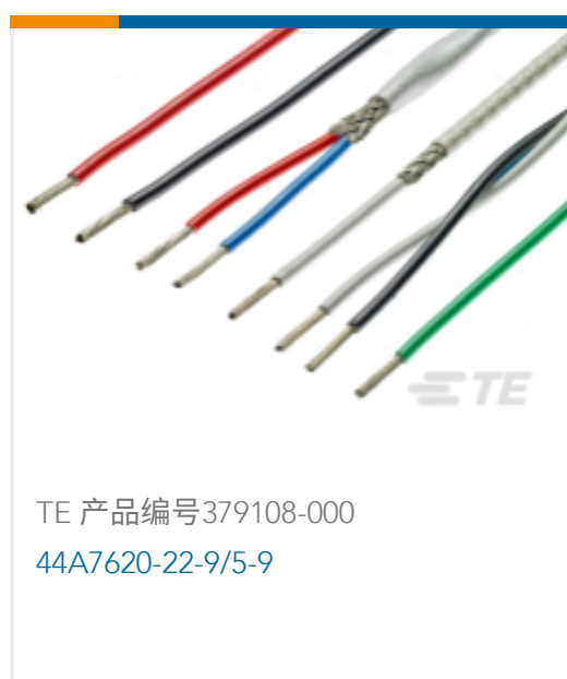
TE 产品编号379108-000 44A7620-22-9/5-9