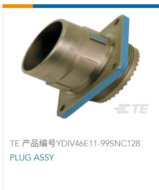
TE 产品编号YDIV46E11-99SNC128 PLUG ASSY