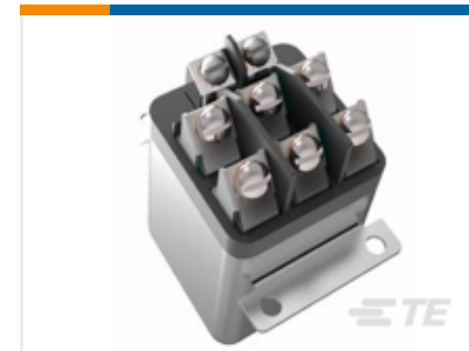
TE 产品编号1617807-5 FC-335-SY8= RELAY, 3PST