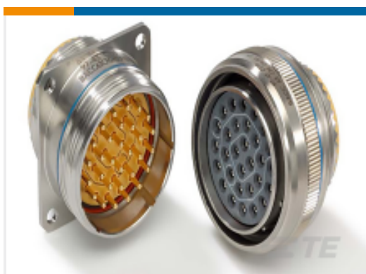
TE 产品编号ZPF100000000008090 983-6K 12-03 SN-L