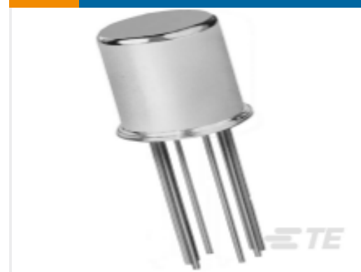
TE 产品编号1617355-1 JMAW-18XP=M39016/9-017P