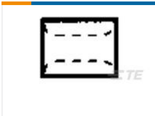
TE 产品编号36491 SPLICE,SOLIS PARA 18-10