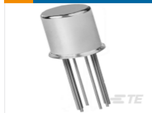
TE 产品编号1617125-4 JMAW-18XL = M39016/9-017L