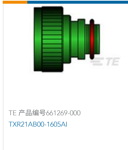
TE 产品编号661269-000 TXR21AB00-1605AI