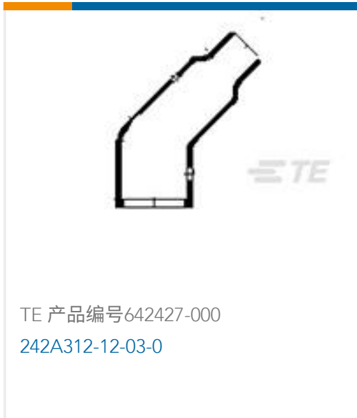
TE 产品编号642427-000 242A312-12-03-0