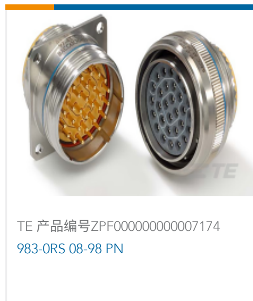
TE 产品编号ZPF000000000007174 983-ORS 08-98 PN