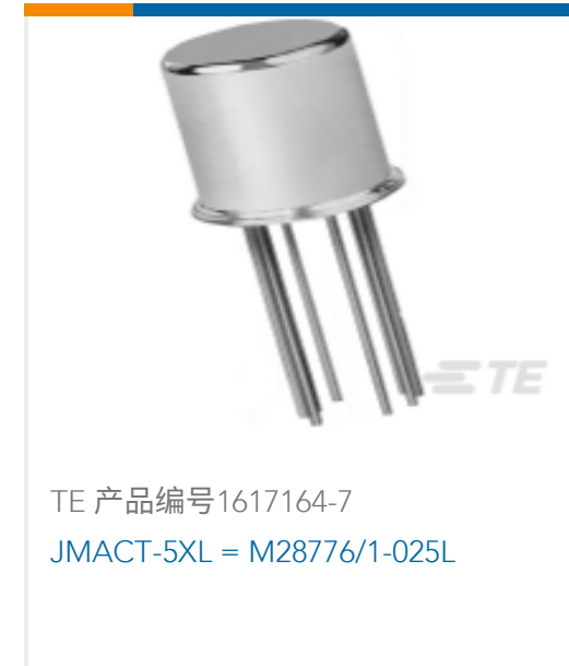
TE 产品编号1617164-7 JMACT-5XL = M28776/1-025L