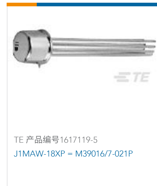
TE 产品编号1617119-5 J1MAW-18XP = M39016/7-021P