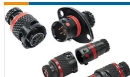
TE 产品编号ASU603-05PC-HE PLUG ASSY ASU 5 WAY