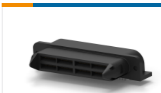
TE 产品编号766515-1 AMPOWER WAVE CRIMP HDR ASSY