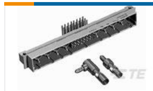
TE 产品编号5148414-5 ASSY,PIN,R.A.,TYPE M,EUROCARD,L-FREE,24+