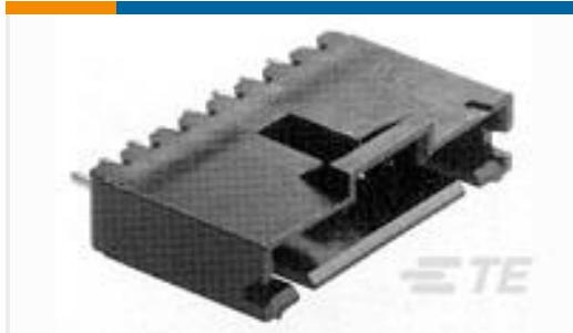
TE 产品编号147321-3 17 MTE VER HDR SR S.LOAD W/RET