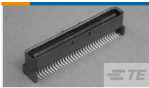
TE 产品编号5146888-2 1FHP,84,30A/S,S,C,S10,12,13,15