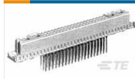
TE 产品编号5148420-5 ASSY,RECPT,TYPE M,EUROCARD,L-F