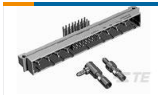
TE 产品编号5148412-5 ASSY,PIN,R.A.,TYPE M,EUROCARD,L-FREE,60+