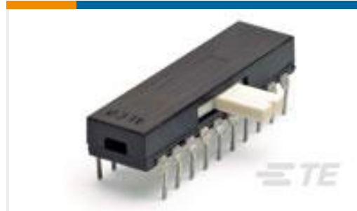
TE 产品编号2-1825010-5 ASE4304=4P3T AUTOSLIDE