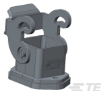
TE 产品编号 T1509031100-000 H3A-AG