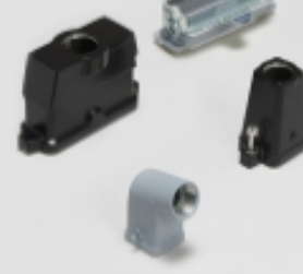
矩形连接器护罩和底座(1258)