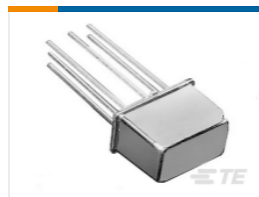
TE 产品编号1617147-5 JMGAP-26P = M39016/17-030P