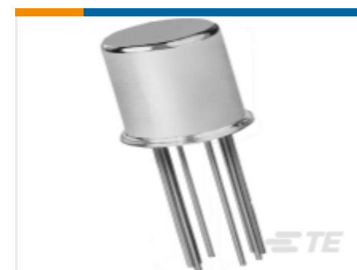
TE 产品编号1617164-7 JMACT-5XL = M28776/1-025L