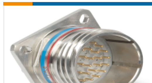
TE 产品编号YACT20MH21PAV00100 SQUARE FLANGE RECEPTACLE