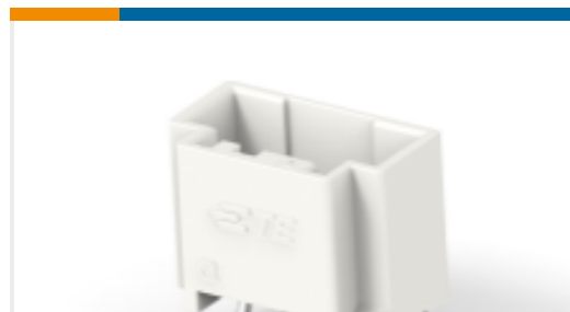
TE 产品编号4-1971800-1 NEW GI CONN2.5 HDR ASMBLY 4P NC D1.5