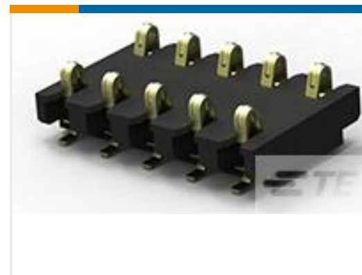
TE 产品编号2199035-2 10 PINS,1.6PICH,1.65H BTOB CONN. 2 ROW