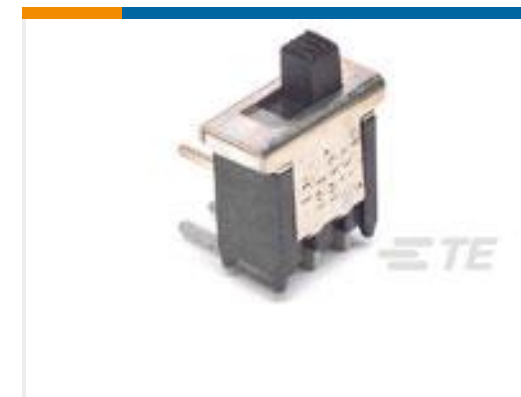
TE 产品编号1571982-2 TSS11DG1PC04=SLIDE SWITCH SPDT