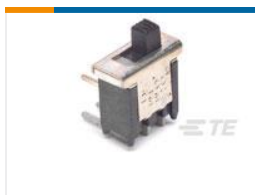
TE 产品编号1571982-3 TSS11EG1PC04=SLIDE SWITCH SPDT