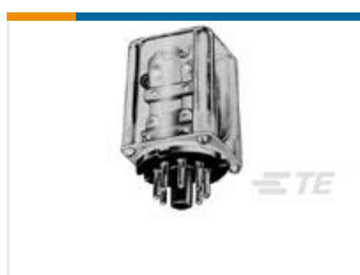
TE 产品编号3-1393100-8 KCP-11-10000=KA/KB/KC/KR