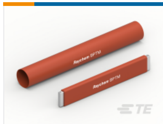
TE 产品编号478203-000 BPTM-30/12-A/U(B50)