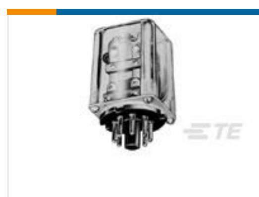
TE 产品编号4-1393100-2 KCP-5-10000=KA/KB/KC/KR