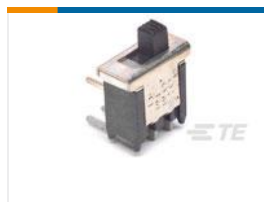
TE 产品编号1571982-4 TSS11EGPC04=SLIDE SWITCH SPDT