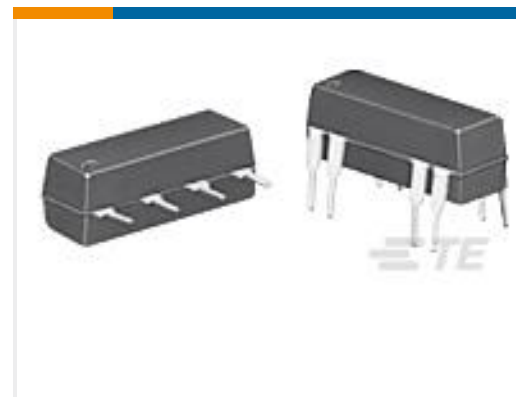
TE 产品编号3-1393771-4 JWS-117-3=REED RELAYS