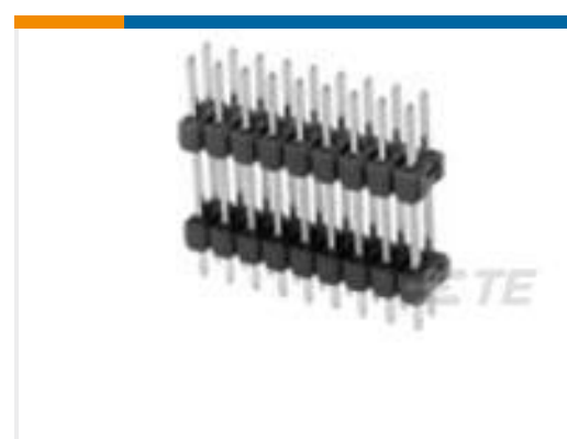
TE 产品编号146507-2 04 MODII HDR DRST UNSHRD STKG