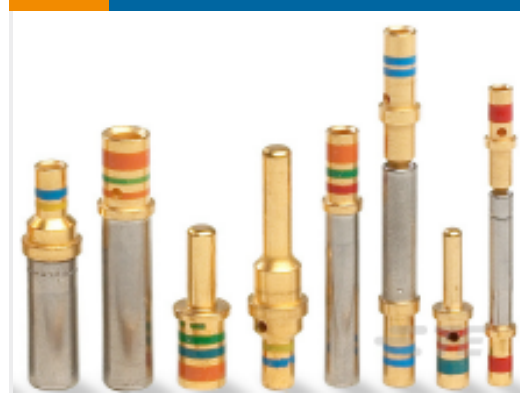
TE 产品编号ZPF000000000000358 006-0937-12 A