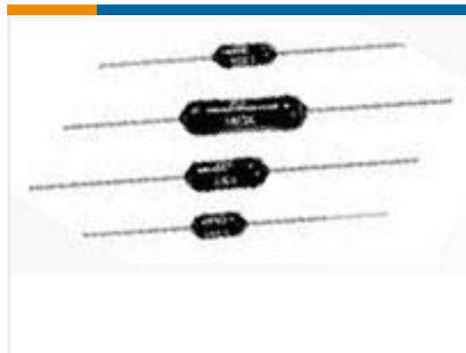
TE 产品编号7-1879665-5 H8 73K2 0.1% 15PPM