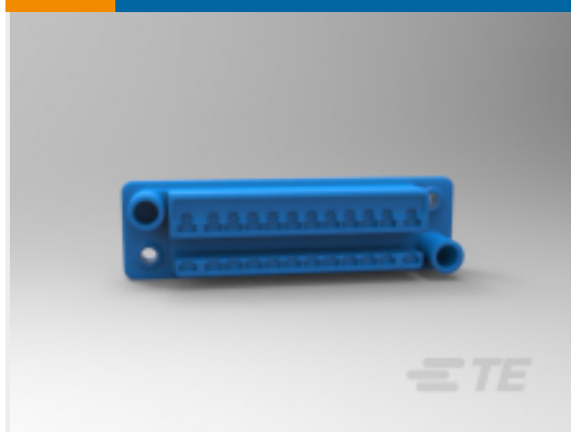
TE 产品编号172653-1 标准抽屉式插头壳体