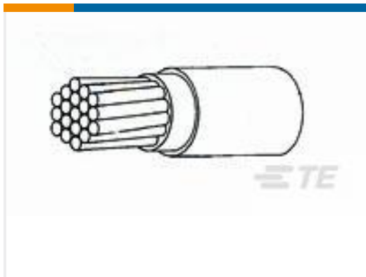
TE 产品编号2822583001 44A0211-18-9