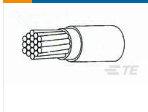
TE 产品编号2823023001 44A0211-12-9