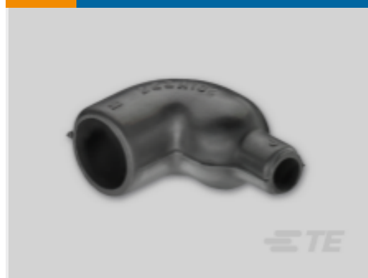
TE 产品编号355737-000 222A163-25-00-0