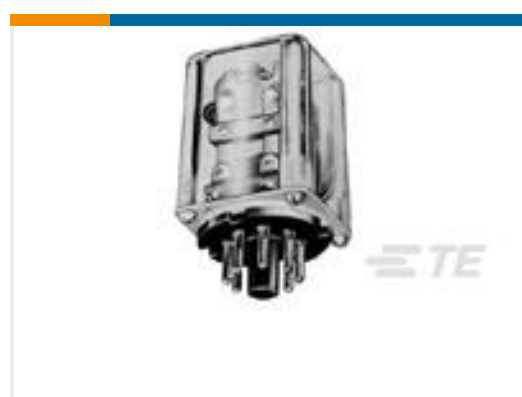
TE 产品编号3-1393100-8 KCP-11-10000=KA/KB/KC/KR