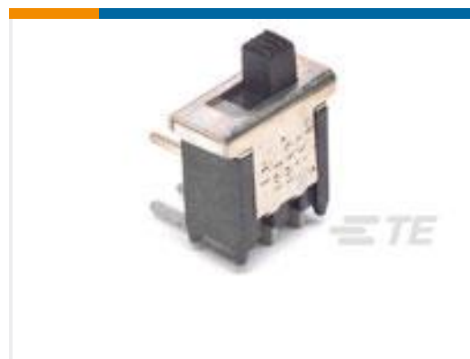
TE 产品编号1571982-3 TSS11EG1PC04=SLIDE SWITCH SPDT