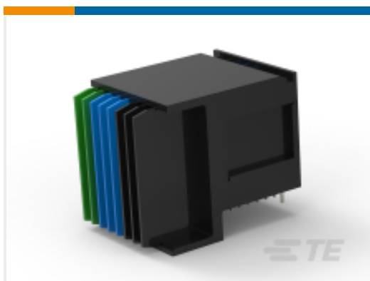
TE 产品编号1410189-4 MULTIGIG RT T2 7RW H-LFT,ET2