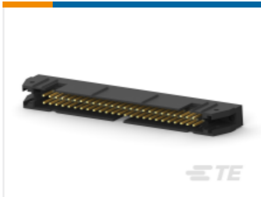
TE 产品编号1-5499922-0 AMP 锁门通用插头