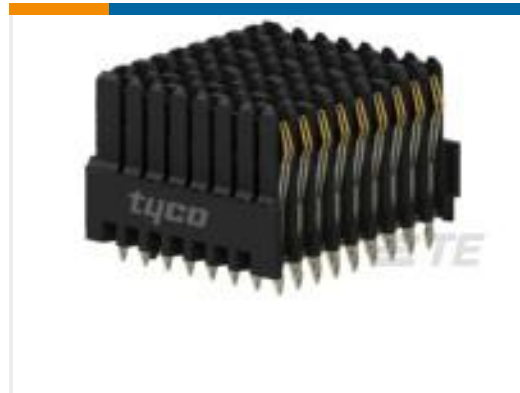
TE 产品编号1410186-1 MULTIGIG RT T2 .8" BP H-LFT