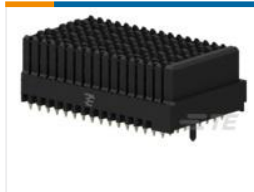
TE 产品编号1410142-1 MULTIGIG RT T2 .8" BP FULL RGH