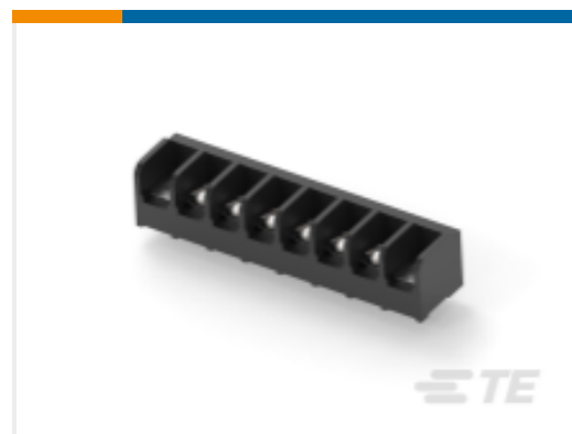
TE 产品编号1437658-3 8PCV-06-410=8PCV-06 W/MTG.