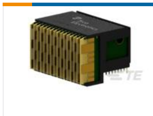
TE 产品编号1410187-4 MULTIGIG RT T2 7RW DC DF CT