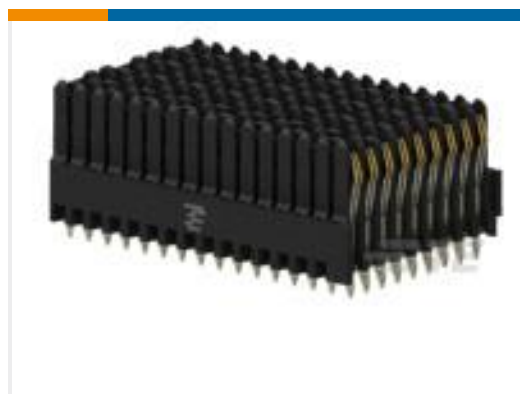
TE 产品编号1410140-1 MULTIGIG RT T2 .8" BP FULL CNT