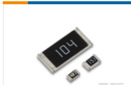
TE 产品编号1-2176345-9 CRGCQ 1210 330R 1%