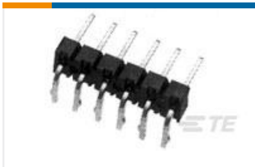
TE 产品编号104349-4 06 MODII HDR SRRA B/A W/HLDWN