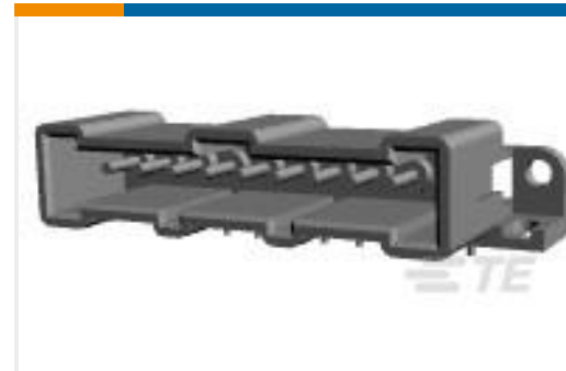
TE 产品编号3-208403-2 PIN HDR ASSY, 10P, MMATE LF