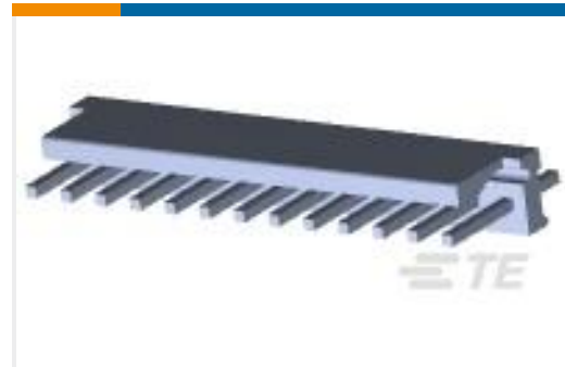
TE 产品编号1-644752-3 13P MTA156 HDR ASSY SQ STR F/L