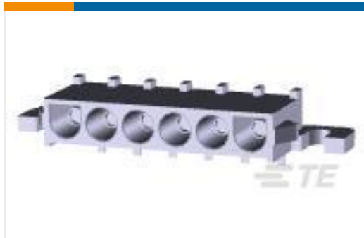
TE 产品编号643235-1 06P UMNLR HDR ASSY R/A NATL