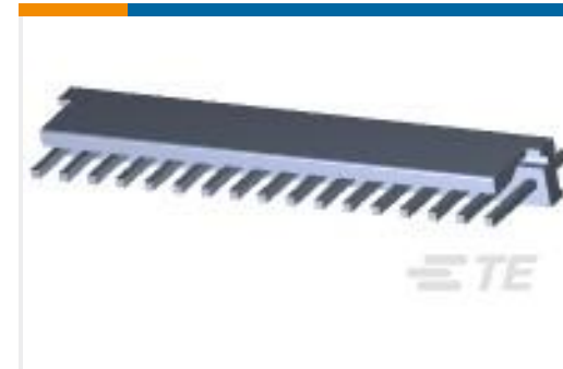
TE 产品编号1-644752-7 17P MTA156 HDR ASSY SQ STR F/L