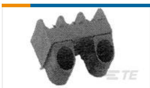
TE 产品编号 1-1437657-1 8DBL-03-006=#8 TRIBARRIER