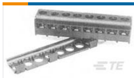
TE 产品编号 5-1437661-0 TC8-03-PFH=COVER w/HOLES