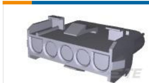
TE 产品编号1-480764-0 05P UMNL CAP HSG NATL