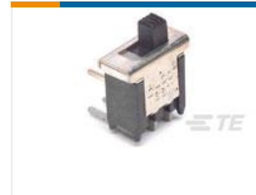
TE 产品编号1571982-2 TSS11DG1PC04=SLIDE SWITCH SPDT