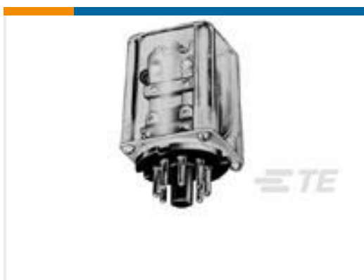
TE 产品编号3-1393100-8 KCP-11-10000=KA/KB/KC/KR