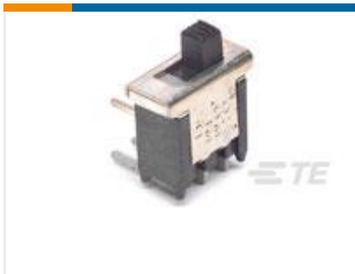
TE 产品编号1571982-3 TSS11EG1PC04=SLIDE SWITCH SPDT