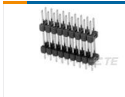
TE 产品编号146507-2 04 MODII HDR DRST UNSHRD STKG