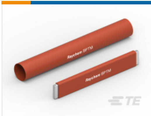
TE 产品编号478203-000 BPTM-30/12-A/U(B50)