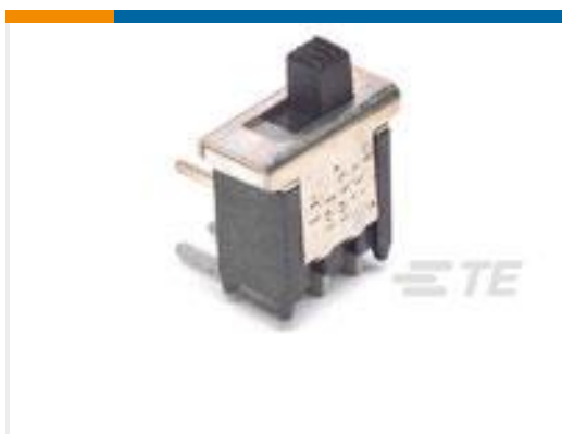
TE 产品编号1571982-3 TSS11EG1PC04=SLIDE SWITCH SPDT