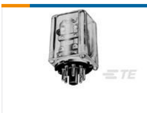
TE 产品编号3-1393100-8 KCP-11-10000=KA/KB/KC/KR