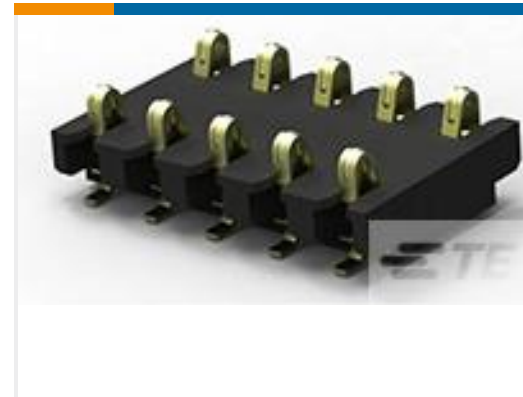
TE 产品编号2199035-2 10 PINS,1.6PICH,1.65H BTOB CONN. 2 ROW