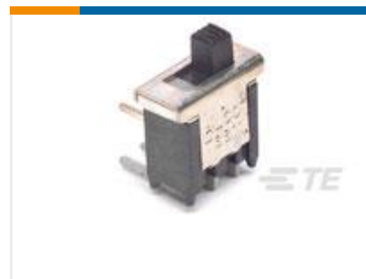
TE 产品编号1571982-4 TSS11EGPC04=SLIDE SWITCH SPDT