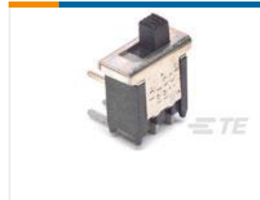
TE 产品编号1571982-2 TSS11DG1PC04=SLIDE SWITCH SPDT