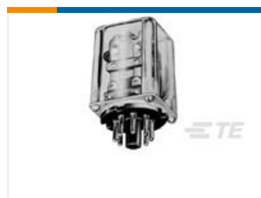
TE 产品编号4-1393100-2 KCP-5-10000=KA/KB/KC/KR