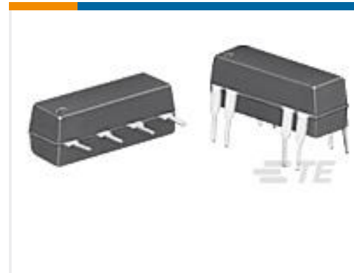
TE 产品编号3-1393771-4 JWS-117-3=REED RELAYS