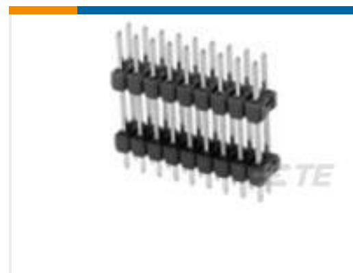
TE 产品编号146507-2 04 MODII HDR DRST UNSHRD STKG