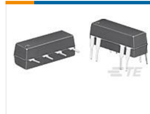
TE 产品编号3-1393771-4 JWS-117-3=REED RELAYS