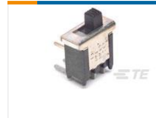
TE 产品编号1571982-2 TSS11DG1PC04=SLIDE SWITCH SPDT