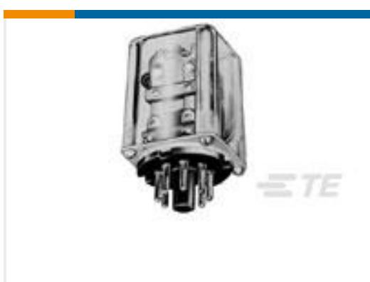
TE 产品编号3-1393100-8 KCP-11-10000=KA/KB/KC/KR