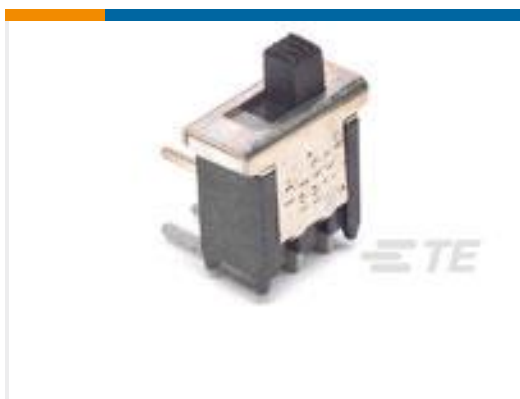
TE 产品编号1571982-3 TSS11EG1PC04=SLIDE SWITCH SPDT