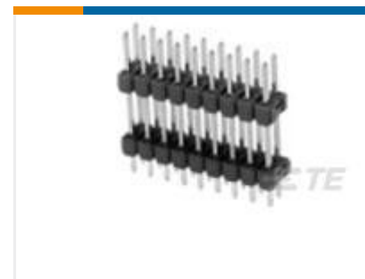
TE 产品编号146507-2 04 MODII HDR DRST UNSHRD STKG