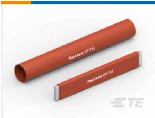
TE 产品编号478203-000 BPTM-30/12-A/U(B50)