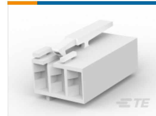
TE 产品编号 2-1241961-7 STD TIM HOUSING MKII 3POS