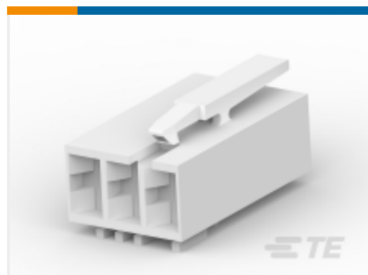
TE 产品编号 9-1241961-8 STANDARD TIMER MARK II HOUSING