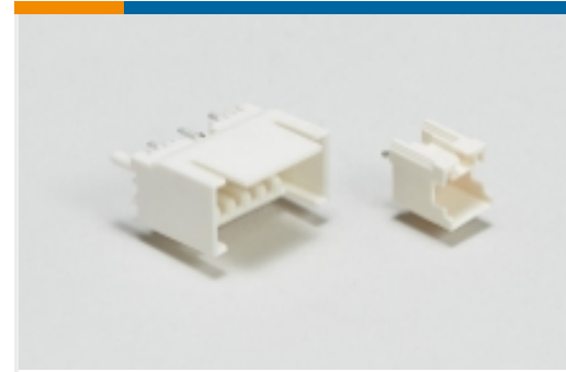
线对板接头和插座(79)