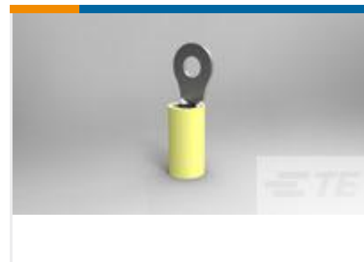
TE 产品编号1-35787-0 N PIDG RING 12-10 8