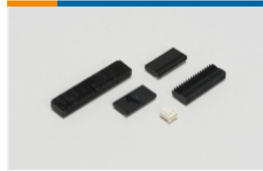
线到板连接器组件和护套(5)