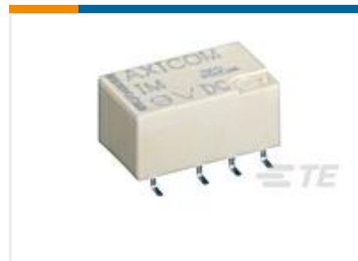
TE 产品编号1462041-3 IMB06CGR 140mW 12V DIELEC.2500