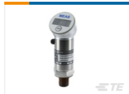
TE 产品编号10214513-00 PRESS XDCR M5842-000005-10KPG