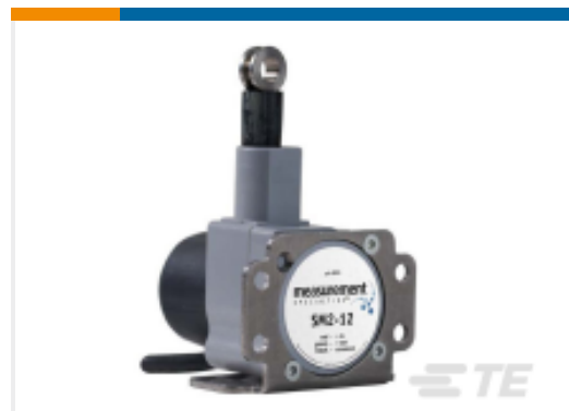
TE 产品编号SM1-25 STRING POT, 25 INCH RANGE