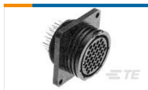
TE 产品编号1986377-2 CPC PSTD RCPT,13-7, rev sex