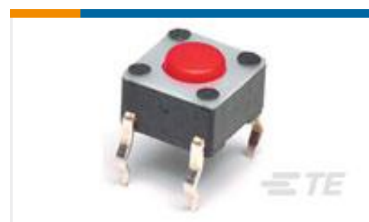
TE 产品编号1825955-2 FSM1JH=6MM TACT SWITCH, HT W /ESD