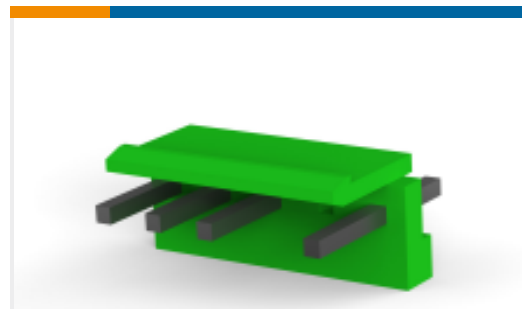
TE 产品编号3-1717011-4 EP CONN.HDR ASSY 4/5P GREEN W /O#4