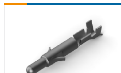
TE 产品编号2825072-1 UMNL PIN 24-18 .0126 PTPBR