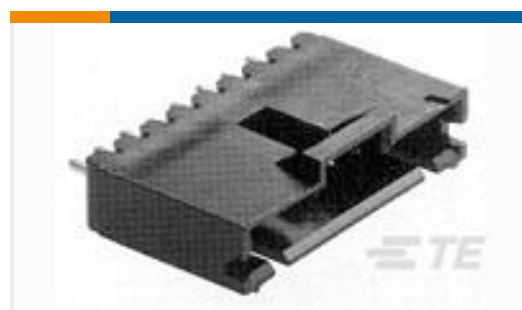
TE 产品编号147574-2 13 MTE HDR W/O SWAGE S.LOAD