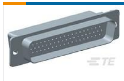
TE 产品编号2101497-5 AMPLIMITE KIT,PLUG,W/IF+GMT,Sz5, 90