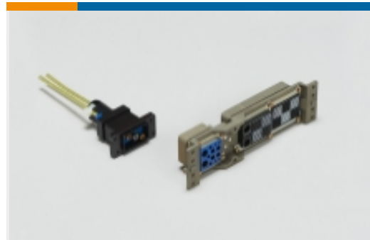
机架和配线架连接器(68)