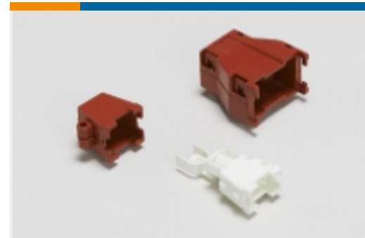
矩形护套和应力消除(1)