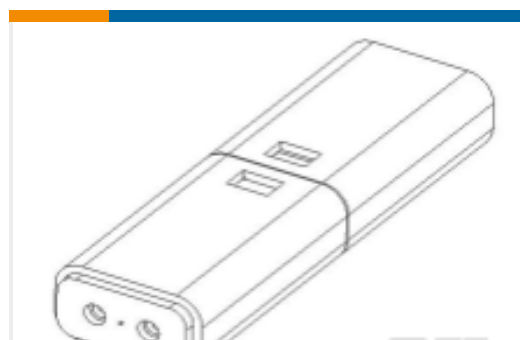
TE 产品编号65053-208 ELEC MODULE