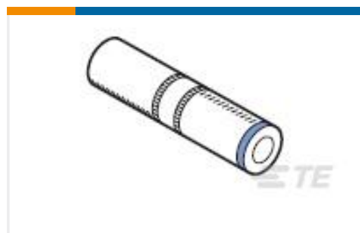
TE 产品编号277164-1 SPLICE,SEALED COPALUM 4AL 8CU