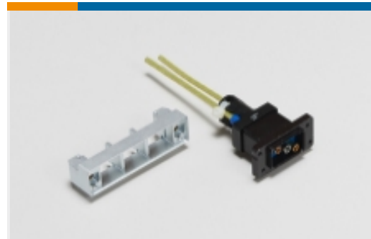
其他机架和配线架附件(2)