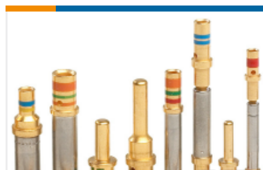
TE 产品编号ZPF0000000000003649 724-8021-22