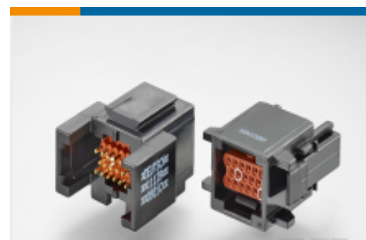
TE 产品编号ABC03R-20S-4048 IN-LINE RECP