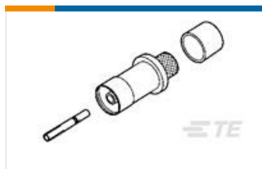
TE 产品编号225831-3 KIT,ARINC COAXICON SOCKET,SZ 1