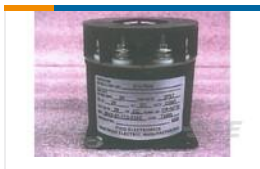
TE 产品编号1616103-2 DH7MN (FAA/PMA)=RELAY