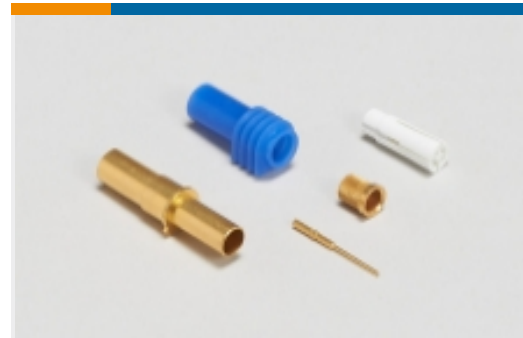
机架和配线架端子(20)