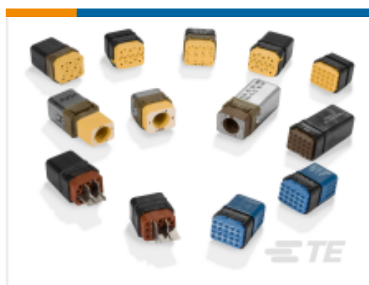
TE 产品编号ZPF000000000163975 DMC-M 99-04 CN (=33537-PC000)