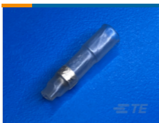
TE 产品编号F78598-000 B-155-1504