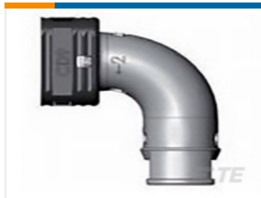
TE 产品编号ZPF000000000110289 787-8055-31M