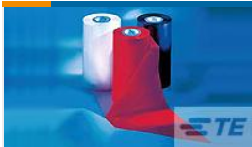
TE 产品编号557721-000 TMS-RJS-RIBBON-4RPSCE