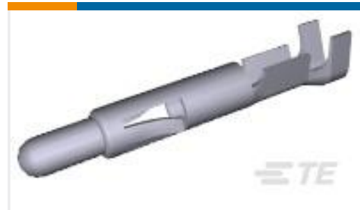
TE 产品编号350690-7 UMNL PIN 24-18 AUBR L/P