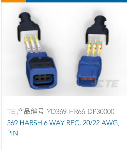
TE 产品编号 YD369-HR66-DP30000 369 HARSH 6 WAY REC, 20/22 AWG, PIN