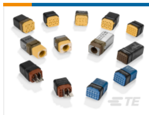
TE 产品编号ZPF000000000163975 DMC-M 99-04 CN (=33537-PC000)