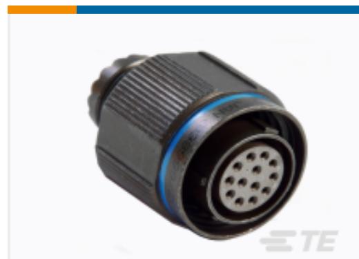
TE 产品编号YACT26MG35SCV00100 STRAIGHT PLUG