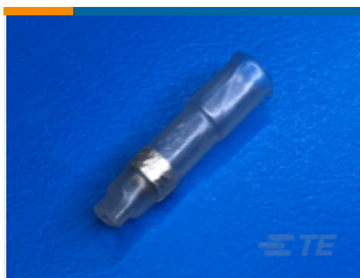
TE 产品编号F78598-000 B-155-1504