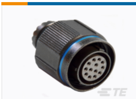
TE 产品编号YACT26MA98SEV00100 STRAIGHT PLUG