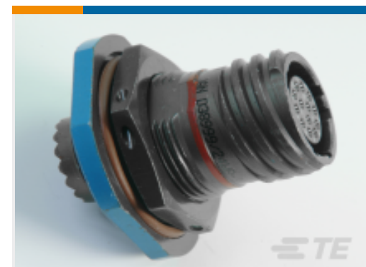
TE 产品编号YACT24MA98SNV00100 JAM NUT RECEPTACLE