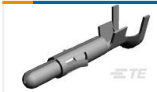
TE 产品编号350552-2 UMNL PIN 20-14 AUBR L/P