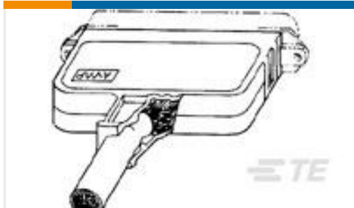
TE 产品编号3-552008-1 KIT, COVER, 180, 50 POS