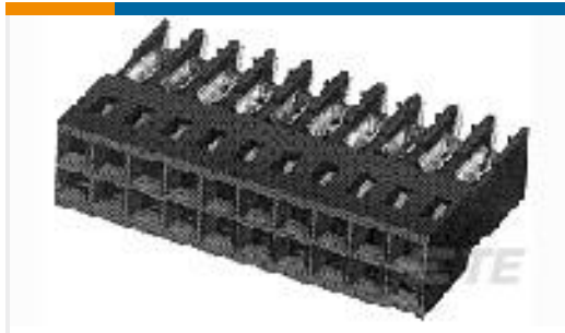
TE 产品编号5-102398-6 16 AMPMODU MT ASSY DR .100CL