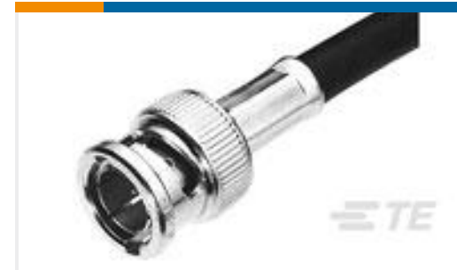
TE 产品编号5413589-1 KIT, PLUG, COML BNC, HEX CRP